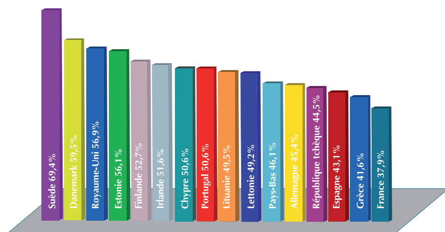
Le taux d'emploi des 54-65 ans dans les pays de l'Union Européenne

Le taux d'emploi correspond à la part des personnes ayant un emploi par rapport à l'ensemble d'une population d'une même classe d'âge.